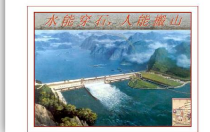
L'Innovation aux sources de la compétitivité

Téléchargement gratuit du rapport , 134 pages - pdf 4,4 Mo